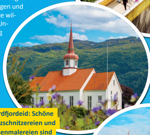
Nordfjordeid: Schöne Holzsznitzereien und Rosenmalereien sind zu bewundern.