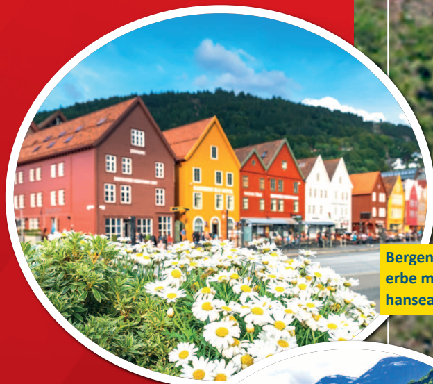
Bergen: UNESCO-Weltkulturerbe mit engen Gassen und hanseatischen Gebäuden