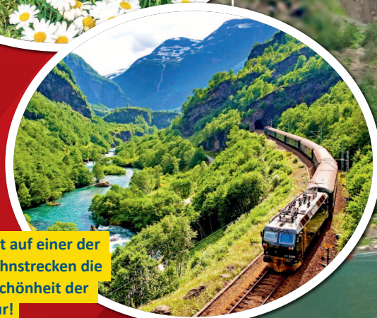
Flåmbahn: Entdeckt auf einer der spektakulärsten Bahnstrecken die atemberaubende Schönheit der norwegischen Natur!