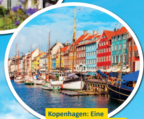
Kopenhagen: Eine einmalige Mischung aus Lebensfreude und Idylle

Komm geh mit mir zum Meer Um auf ein Schiff zu gehen. Komm geh mit mir zum Meer Um in die Welt zu sehen. Unheilig – Das Meer