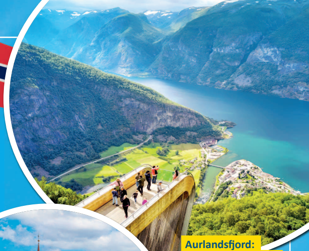
Aurlandsfjord: Grandioser Panoramablick vom Stegastein-Aussichtspunkt 650 Meter über dem Fjord

einen Höhenunterschied von über 860 Metern. Als nächsten Hafen erreicht ihr Nordfjord-eid. Der Ort überrascht mit ursprünglicher Ruhe und authentischem norwegischen Charme. Umgeben von Bergen und Fjorden entdeckt ihr hier die wilde Schönheit Norwegens. Un-ternehmt z.B. einen Ausflug zur majestätischen Gletscherzunge des Briksdal-Gletschers oder fahrt mit der steilsten Pendelseilbahn der Welt in kürzester Zeit in schwindelerregende 1.011 m Höhe zum Gipfel des Bergs Hoven. Zum krönenden Abschluss wartet Kopenhagen: modern, kreativ und voller Lebensfreude. Design, Genuss und Geschichte verschmelzen zu einer Stadt, die man sofort ins Herz schließt – vom Nyhavn bis zur kleinen Meerjungfrau.